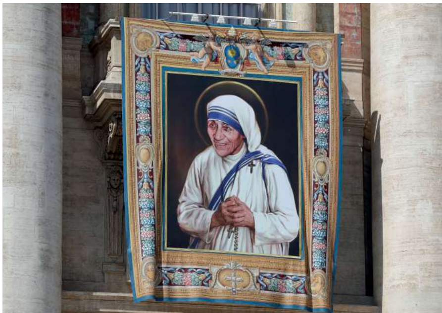
Canonización de santa Teresa de Calcuta (2016)