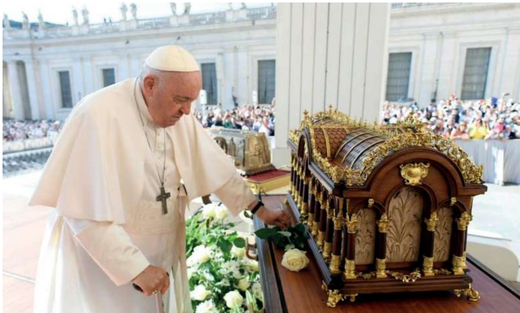
El papa Francisco coloca una rosa blanca junto a las reliquias de santa Teresa del Niño Jesús

Su doctrina es de una profundidad mística extraordinaria, pero expresada con una sencillez accesible incluso a los niños. Por eso la propongo a toda la Iglesia como guía segura en el camino de la santidad» ( El papa Francisco y santa Teresita , ibíd.).