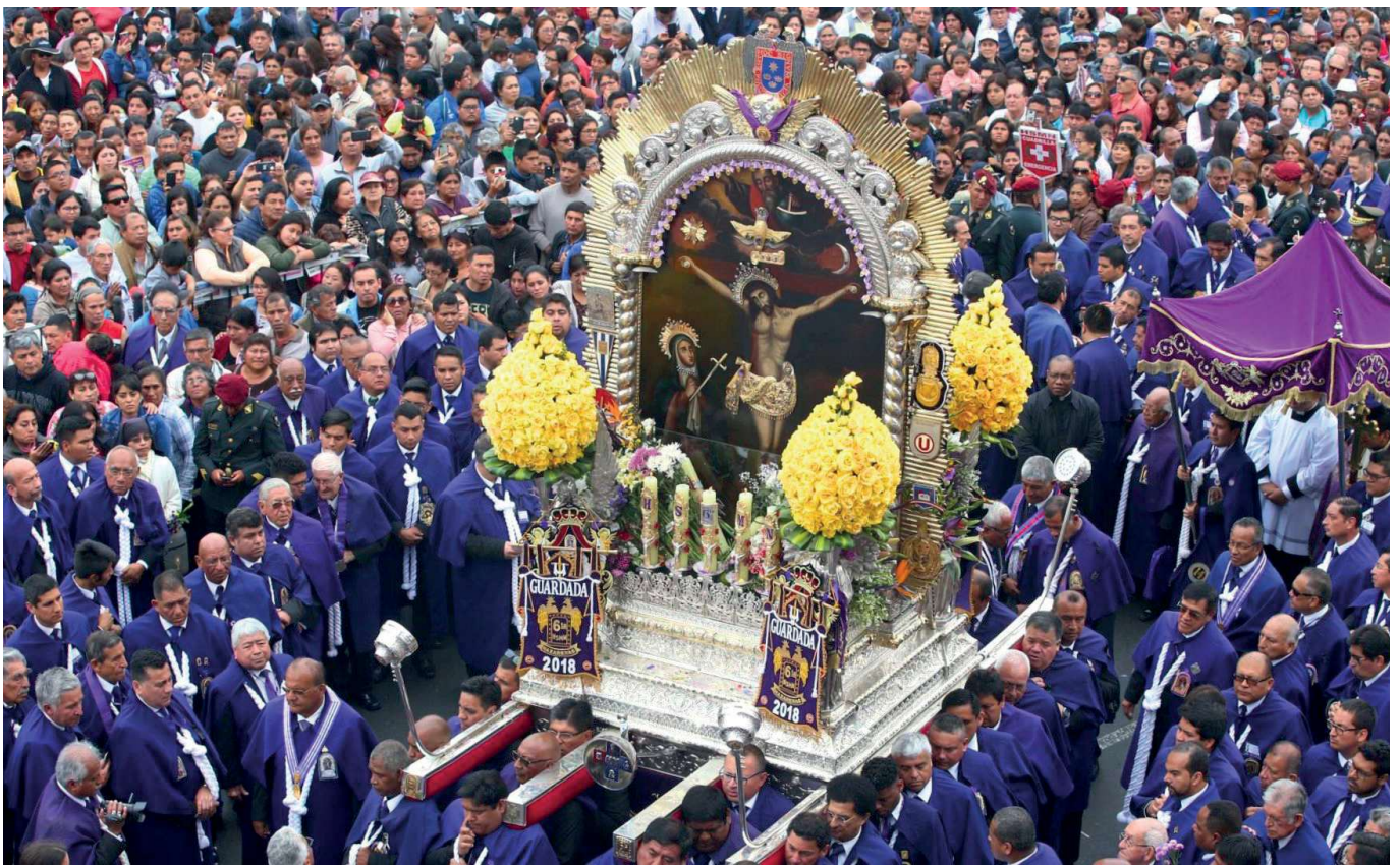
Procesión del Cristo de los Milagros en Lima (Perú)

man en serio las palabras del Señor: «Te doy gracias Padre, porque has ocultado estas cosas a los sabios y entendidos, y se las has revelado a la gente sencilla.» ¡Cuántas veces esta religiosidad de los humildes ha venido al rescate de la ortodoxia y ha sabido reconocer las verdades de la fe mejor que los grandes teólogos! Se necesita una mirada verdaderamente sobrenatural y no mundana de las cosas para saber descubrir en gestos de apariencia humilde la acción de la gracia de Dios, que no deja de hacerse presente en su Iglesia. Muchos documentos del papa Francisco reflejan esta mirada sabia y llena de fe que estamos llamados a compartir.