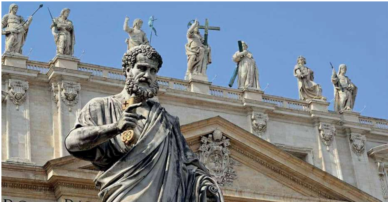
Estatua de san Pedro, en el Vaticano

actitudes; en el caso de que se dé un contraste cierto entre las palabras y los gestos valdría aquello de: «haced todo lo que os digan, pero no obréis conforme a sus obras». Pero además es doctrinal e históricamente cierto que puede obrar en forma impropia y dañosa para la fe al impedir con el peso de su autoridad el curso de una polémica doctrinal. No es infalible cuando manda callar, salvo en el caso en que prohíba solemnemente una doctrina como herética. Las implicaciones de las polémicas soteriológicas posttridentinas crearon una situación en la que vino a ser considerada de hecho como opinable, no ya los diversos modos de explicar la eficacia de la gracia, sino la negación de la eficacia intrínseca de la misma gracia divina, lo que ha perturbado durante siglos la posibilidad del diálogo católico-protestante. Y en las polémicas cristológicas antimonotelitas Honorio cortó como «cuestión de gramáticos» las precisiones doctrinales de Sofronio y de Máximo el Confesor, expresión