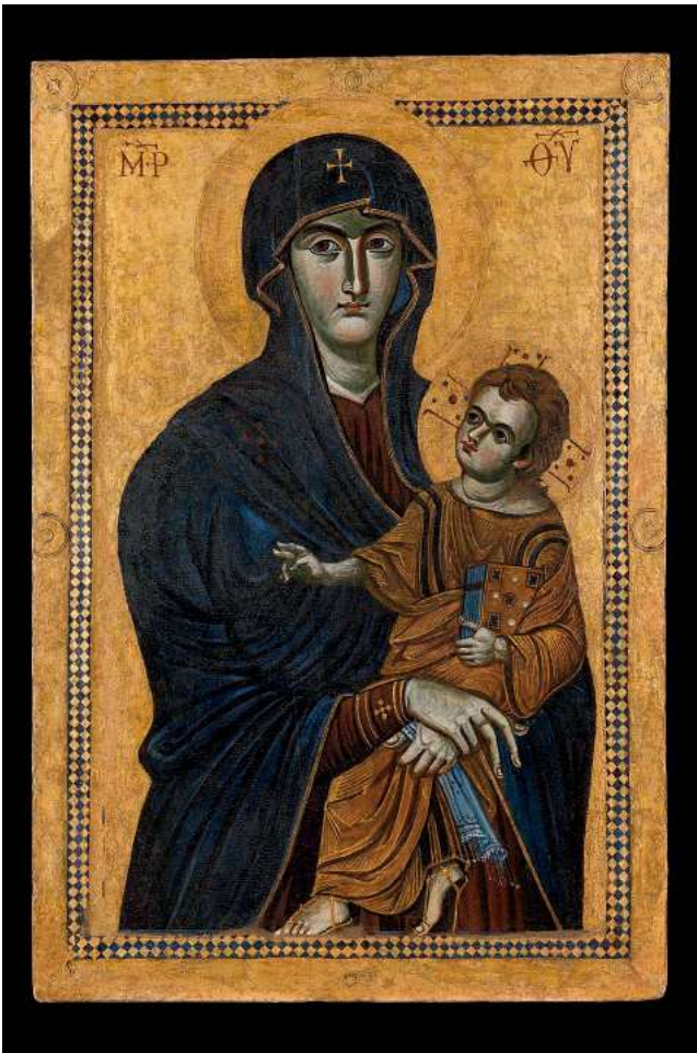
Icono de la Salus Populi Romani que se encuentra en la basílica de santa María la Mayor de Roma ante la cual el Papa solía ir a rezar.

E L papa Francisco dispuso que su último lugar de descanso fuera a los pies de la imagen de la Salus Populi Romani , en la basílica de Santa María la Mayor, en Roma y no en la basílica de san Pedro con la mayoría de papas de la Iglesia. También pidió ser enterrado con un sencillo rosario de madera y cordel en las manos, quiso esperar al día de la Resurrección a los pies de la Madre, aferrado a su amor por la Madre de la Iglesia.