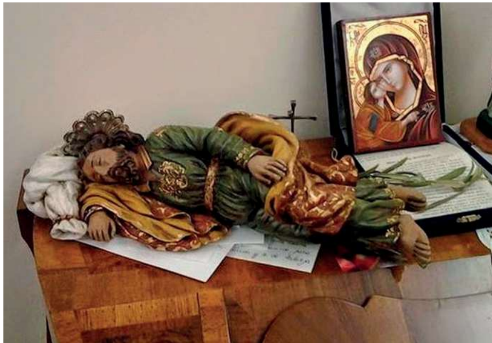
San José dormido que se encontraba en la habitación del papa Francisco

«Después de María, Madre de Dios, ningún santo ocupa tanto espacio en el magisterio pontificio como José, su esposo [...] La grandeza de san José consiste en el hecho de que fue el esposo de María y el padre de Jesús. En cuanto tal, «entró en el servicio de toda la economía de la encarnación», como dice san Juan Crisóstomo [...] En cada circunstancia de su vida, José supo pronunciar su “ fiat ”, como María en la Anunciación y Jesús en Getsemaní.» (Carta apostólica Patris Corde , 8 de diciembre de 2020).