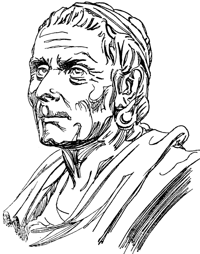
Juan Jacobo Rousseau

"Sabemos que ya desde el principio de la Iglesia fueron perseguidos los cristianos, con semejantes y peo-