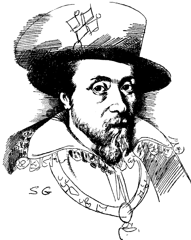
Jacobo I de Inglaterra

No tardó la Iglesia en ilustrar con su opinión la de los católicos que creían incompatible con su fe la fórmula establecida. Un Breve del Pontífice, confirmado por otro semejante al cabo de un año, manifestaba a los católicos ingleses que la prestación del juramento era inconciliable con la fe y con la salud del alma; y a poco, una carta del cardenal Belarmino al Arzobispo Administrador de la Iglesia de Inglaterra le orientaba sobre los deberes de