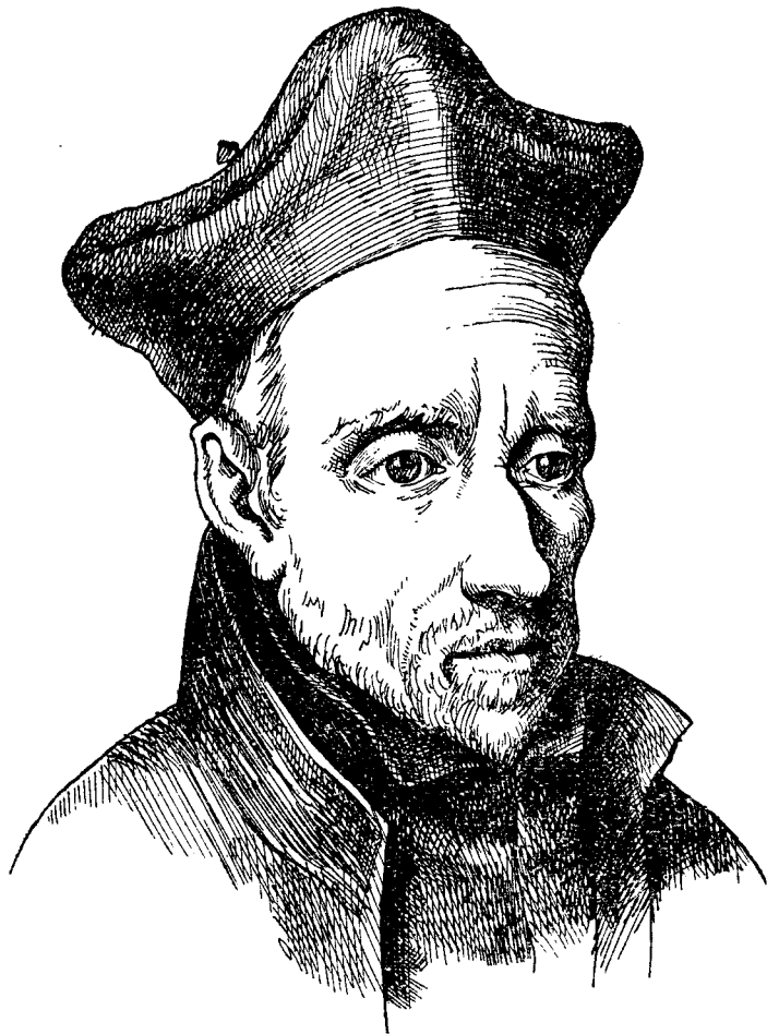
El P. F. Suárez

reputarse como antigua, recibida, verdadera y necesaria. Seguimos de la mano de la Iglesia si no bajo obligación de dogma, con necesidad de doctrina. Las formas especiales para la recepción de la autoridad por el príncipe no pretende definir las la Iglesia: caen fuera de su doctrina. Pero Jacobo se apartaba evidentemente de ella al creer que había recibido de Dios su autoridad por modo directo, tal como le fué dada la suya al Vicario de Jesucristo sucesor de Pedro. De ser esto cierto la realeza de Jacobo se hallaría desligada de toda otra autoridad en la tierra, sea temporal, sea la espiritual del Papa. Su teoría, hija del libre examen, lleva, pues, el sello religiosamente anárquico que caracteriza toda la concepción religiosa del protestantismo. Porque si cada soberano ha de dar cuenta a Dios únicamente de sus actos, sin que una autoridad espiritual defina la suya temporal, no en tales actos de gobierno, precisamente, pero sí en cuanto a las leyes morales a que aquellos actos han de someterse por necesidad tanto en el orden privado como el público, el cristianismo daría origen a un número de credos religiosos igual al de soberanos que puedan convivir dentro de esta fe.