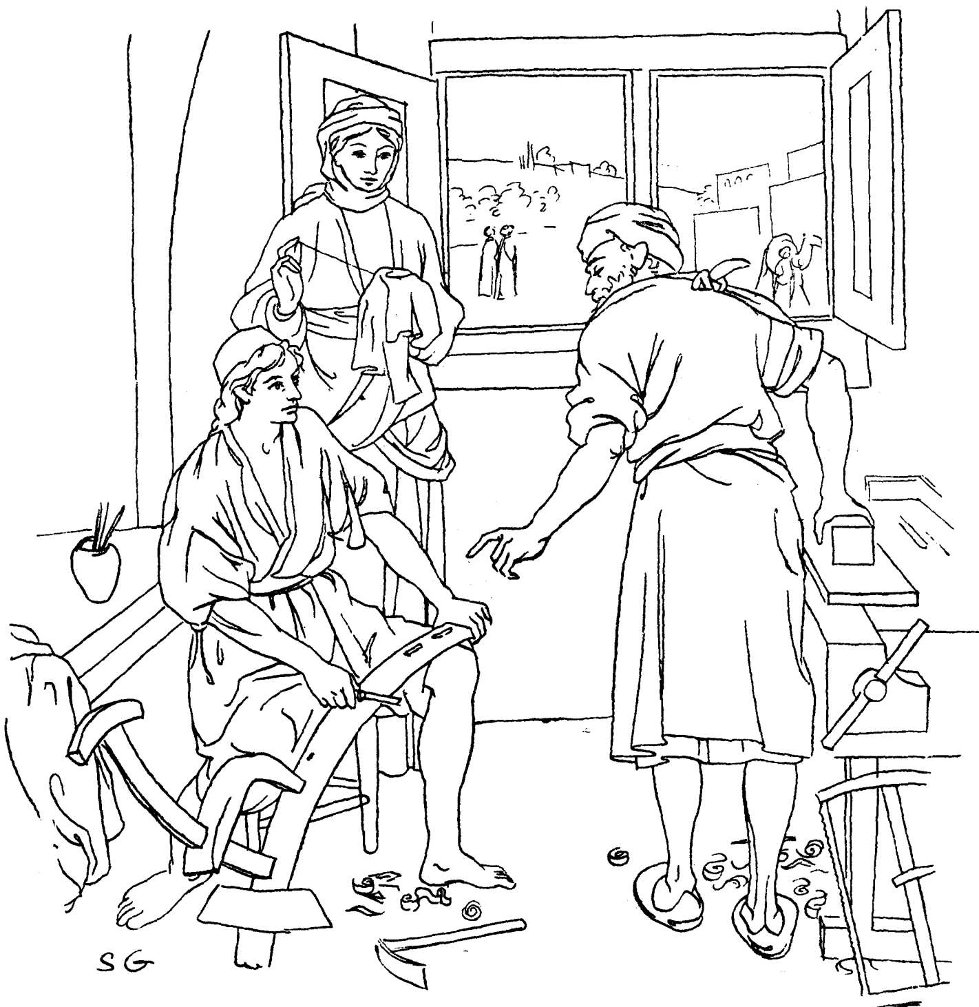
La Sagrada Familia de Nazaret —en cuya fiesta se publica la exhortación Apostólica Christifideles laici de Juan Pablo II—, Iglesia doméstica por antonomasia, modelo de vida cristiana para todos, especialmente los laicos, y ejemplo exímio de santificación de la vida cotidiana.