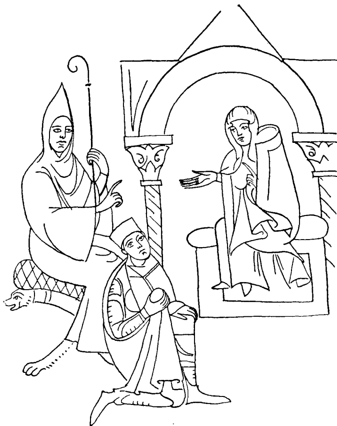
La humillación de Canossa (Manuscrito Vaticano)

Sus efectos fueron inmediatos. Así en el Registrum de Gregorio, haciendo alusión al sínodo de 1075, se hace