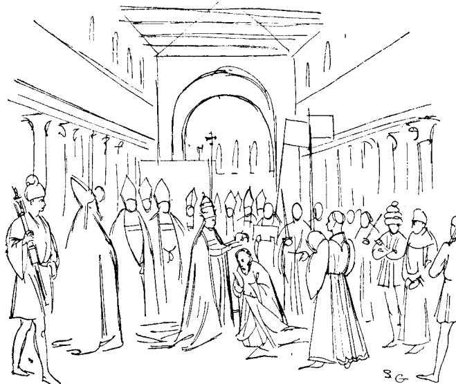
Coronación de Carlomagno en Roma (De un manuscrito antiguo - Siglo XV)

Otón I de Sajonia fué el soberano que adquirió el prestigio y el poder suficientes para recibir la herencia imperial y restaurar el Sacro Imperio Romano que desde entonces recibiría además el apelativo de germánico. Su matrimonio con Adelaida, viuda del rey Lotario de Italia